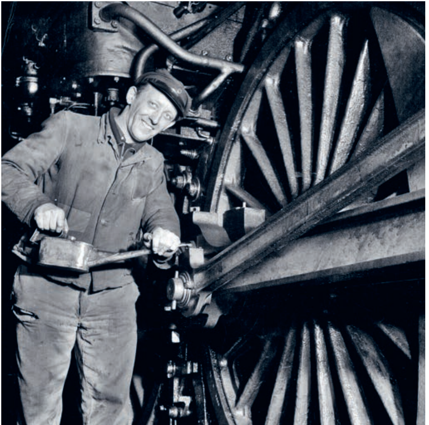
Heizer beim „Abölen“ seiner Dampflok