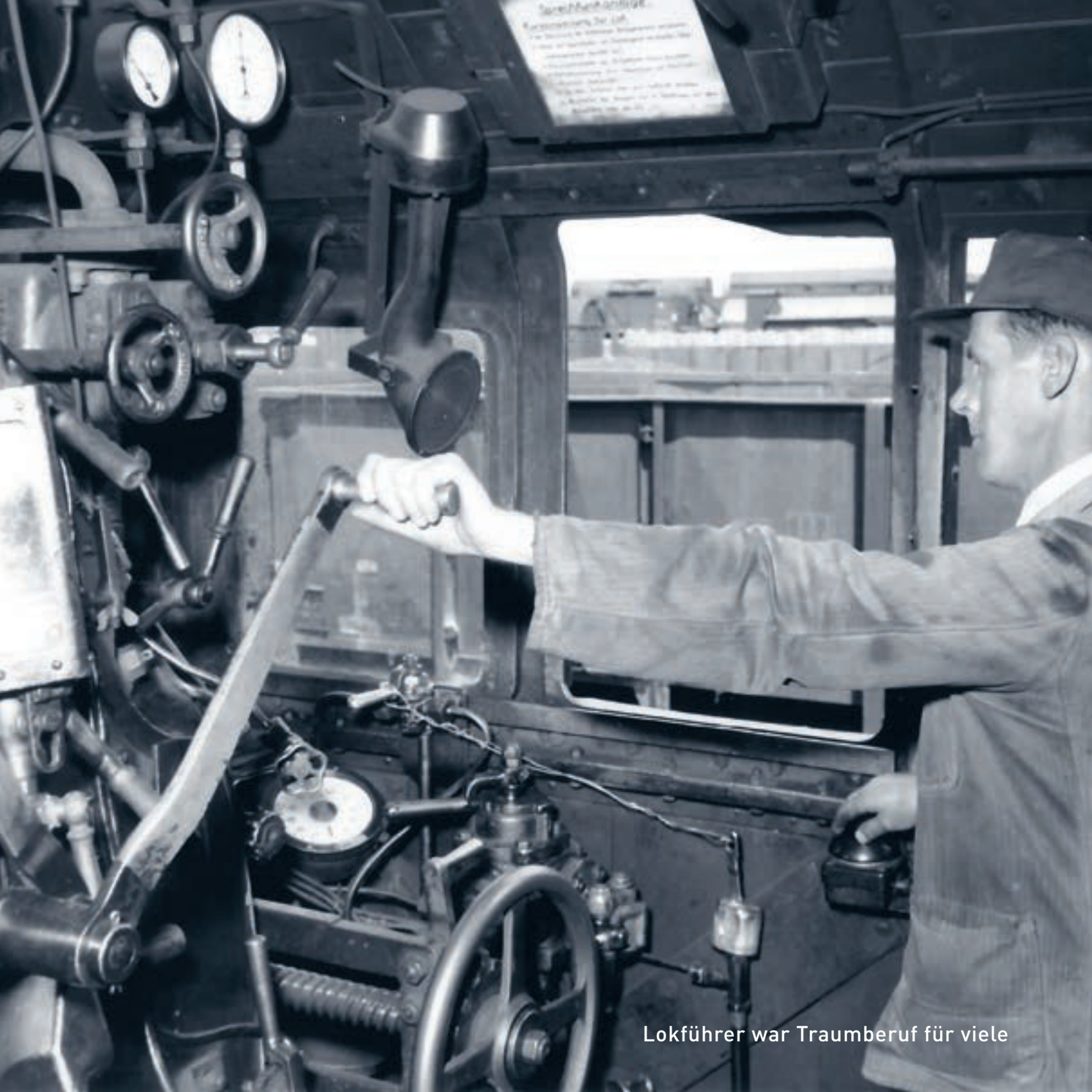
Lokführer war Traumberuf für viele