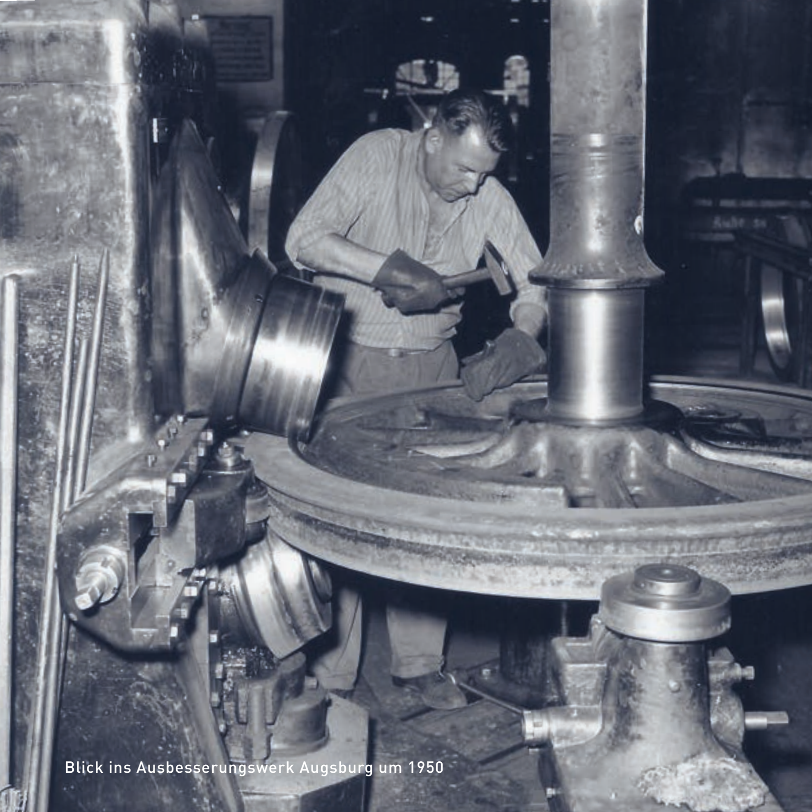
Blick ins Ausbesserungswerk Augsburg um 1950